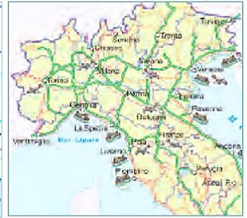
Carta delle vie di comunicazione.

Le FONTI : documenti verbali e non verbali che testimoniano la reale esistenza di un fatto o di un fenomeno del passato